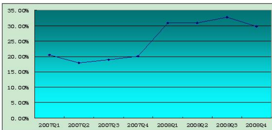
图 1 2007 年 1 季度—2008 年 4 季度银保业务占全国总保费收入占比曲线图

3. 银保业务快速扩张。 2008 年 1 季度银保业务实现保费收入同比增长 128.71%，2 季度同比增长 159.58%，3 季度同比增长 158.27%，4 季度同比增长 106.53%。但从 4 季度开始，银保业务增幅明显下降，代理保费占全国总保费比例为 29.77%，与上季度相比，下降了近 3 个百分点。