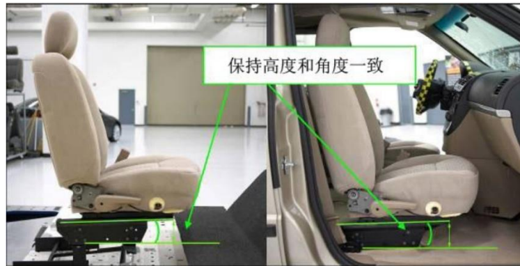
图 5 座椅在车辆和台车上的安装