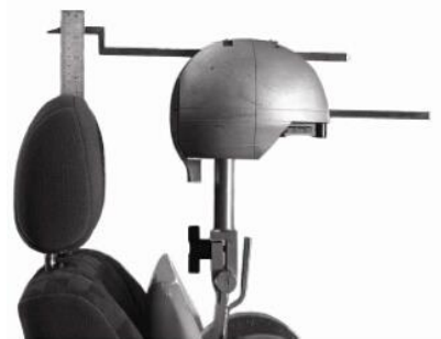
图 2 头枕高度测量

HRMD 中安装两个探针，用于测量头枕高度 (见图 2) 和头后间隙 (见图 3)。