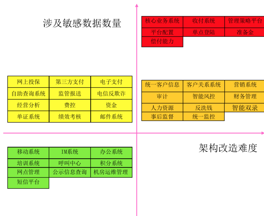
图1 保险业信息系统分类